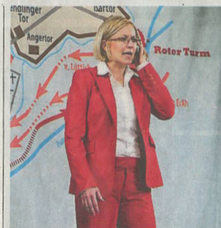
Die Reporterin ist erschüttert, andere geben die Nachrichten vom Gemetzel nüchtern weiter (oben).

Die Protagonisten des eigentlichen historischen Geschehens rekrutieren sich aus je sechs Frauen und Männern, die diverse Gruppen darstellen: Bauersmägde, Münchner Bürgerfrauen oder Mitarbeiterinnen eines Nachrichtendienstes respektive bayerische Oberländer oder kaiserliche Soldaten. Effektvolle Choreographien und oft schlaglichtartige Dialoge verleihen ihren Auftritten Schwung und Intensität. Historische Gewänder hat niemand an, das Grauen von damals soll Gelegenheit haben, sich in der Fantasie des Publikums abzuspielen. Requisiten und Bühnengestaltung (im Hintergrund hängen Karten mit Routen der Aufständischen und später München mit den Schlachten) sind eher sparsam verwendet. Die Sprache, die Everding einsetzt,